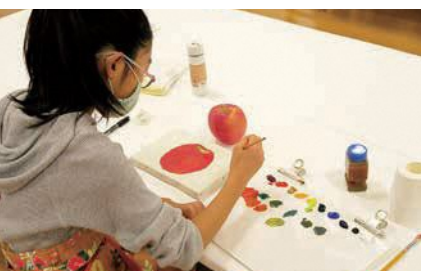
油絵の具を混ぜ合わせ、自分で色を作ります

▶ 油絵に挑戦 油絵の具が初めてでも大丈夫。モチーフをよく観察して、油絵を描いてみよう 📅8月28日(土) 13時30分~16時 🧑小学4~6年生 抽選18人 💰2,200円 📄~8月10日(火) 直接来館またはホームページ申込フォーム