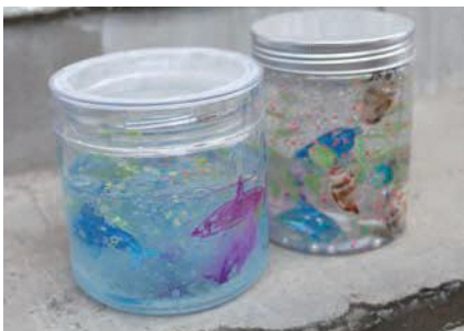
夏の思い出作りにぴったりです

▶ こども工作教室 スライムアクアリウム きらきら輝くスライムを、好きな素材と瓶に閉じ込めて、オリジナル作品を作ります 📅8月29日(日) ①14時~14時45分 ②15時~15時45分 🧑①5歳~小学2年生 先着5人(保護者同伴) ②小学3年生以上 先着10人 ※保護者同伴不可 💰500円 📄7月11日(日)~ ホームページ申込フォーム